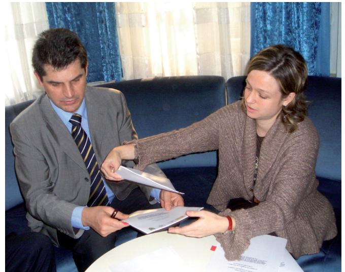
Firma de un convenio de colaboración con el Ayuntamiento. Zrenjanin, Serbia, diciembre 2005.