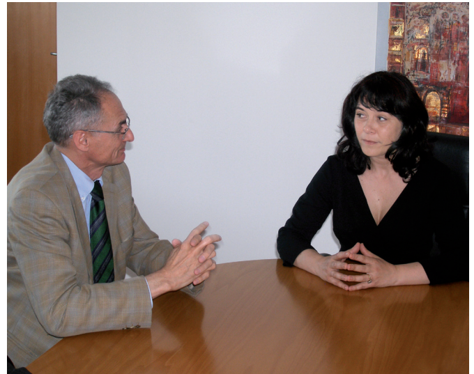
Reunión con el Presidente del Consejo General de la Judicatura y la Fiscalía. Sarajevo, Bosnia-Herzegovina, mayo 2008.

Esta publicación, sin embargo, tiene por objetivo presentar los proyectos propios del Síndic de Greuges de Catalunya a lo largo de diez años, los cuales han sido cofinanciados básicamente por la AECID, la ACCD y la Misión de la OSCE en Serbia.