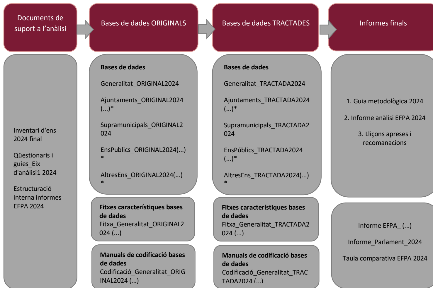
Gràfic 2. Diagrama dels resultats del projecte de transparència 2024