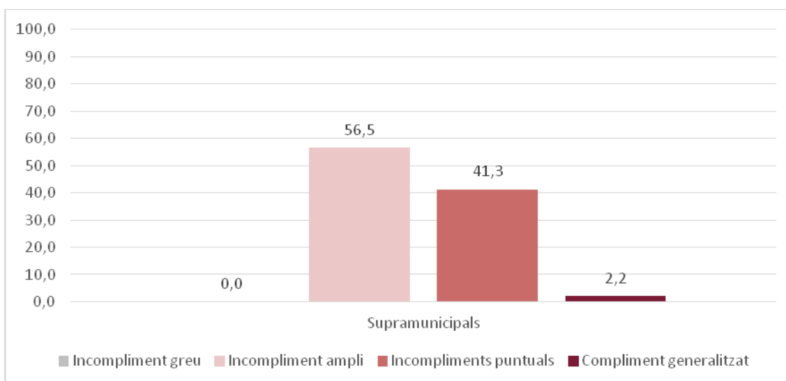
Gràfic 3. Nivells de compliment dels ens supramunicipals. Percentatge