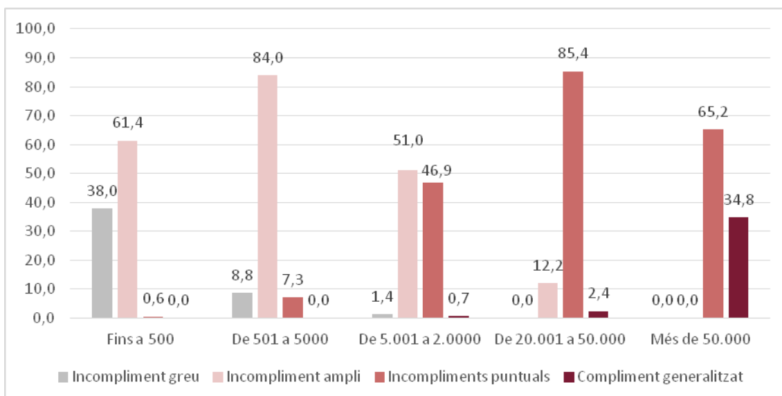
Gràfic 2. Nivells de compliment dels ajuntaments. Percentatge